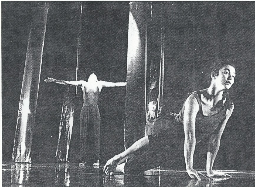
Una escenificación de «Paisaje de aluminio».

En esta ocasión, Esteve Graset trae a Valencia seis instalaciones de diverso significado, ideadas en épocas distintas, pero que en su conjunto «pueden propiciar lecturas múltiples». Se trata de una especie de exposiciones móviles, piezas escultóricas y escenográficas,