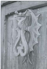
Detall d'un tirador de porta

aquest cas, Antoni Mas ha preferit traspassar l'escultura figurativa per a representar una escultura més aviat evocadora de la música, en la qual quatre fines línies recorden les línies del pentagrama i, al seu centre, una gran figura rodona que s'expandeix com si fos el so de la música.