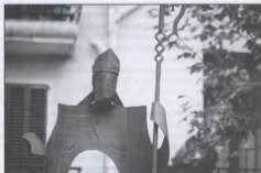
▼ Escultura mural al CEIP Sant Bernat