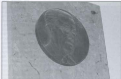
Medalló de l'IES Ramon Barbat i la rosassa de l'església