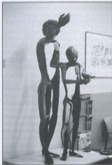
Homo jove i colom ▲

Si comencem la nostra particular ruta per la plaça de Voltes veurem que està presi-